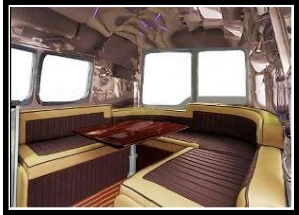
A Parma c'è poi l'anteprima nazionale dello show car Renault Mastertream, concepito e costruito da Midway Pro, ispirandosi alle roulotte americane degli anni '60.